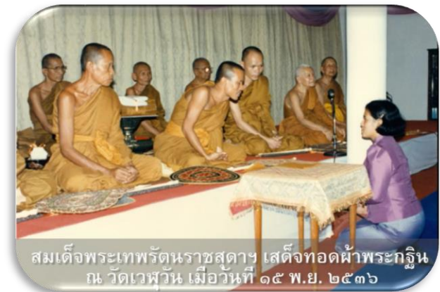
สมเด็จพระเทพรัตนราชสุดาฯ เสด็จทอดผ้าพระกฐิน ณ วัดเวฬุวัน เมื่อวันที่ ๑๕ พ.ย. ๒๕๓๖

ความสำคัญของวัดเวฬุวัน ประการแรก เป็นวัดที่ได้รับพระราชทานพระบรมราชานุญาต ให้สร้างปูชนียวัตถุสำคัญ (พระบรมรูป ร.๕) ประดิษฐานไว้ได้รับพระราชทานพระราชูปถัมภ์ จากสมเด็จพระเทพรัตนราชสุดาฯ สยามบรมราชกุมารี เสด็จฯ ไปทรงทอดผ้าพระกฐิน และสมเด็จพระญาณสังวร สมเด็จพระสังฆราช สกลมหาสังฆปริณายก ทรงรับไว้ในพระสังฆราชูปถัมภ์