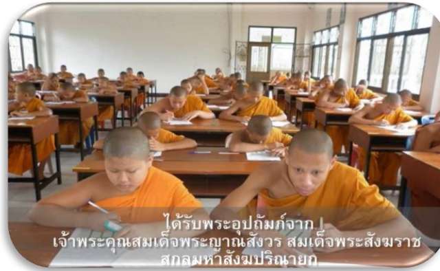
ได้รับพระอุปถัมภ์จาก เจ้าพระคุณสมเด็จพระญาณสังวร สมเด็จพระสังฆราช สกลมหาสังฆปริณายก