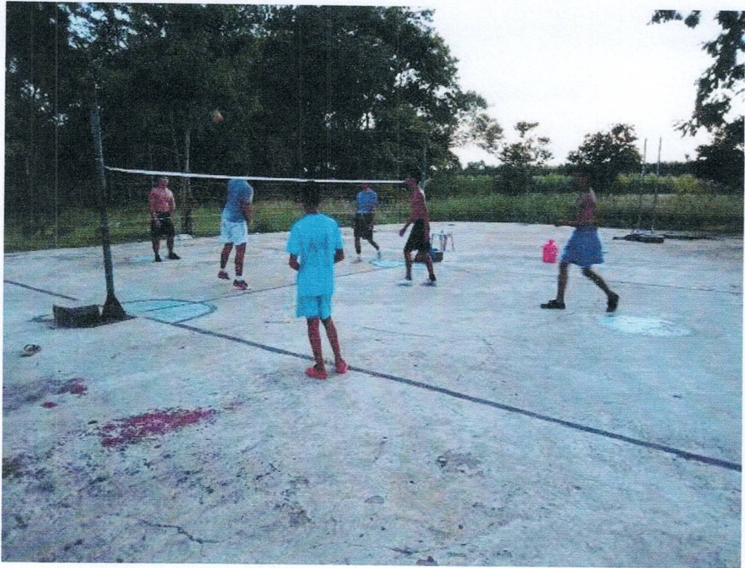
สนามกีฬา/ลานกีฬา หมู่ที่ 13 บ้านโคกสำราญรุ่งเรือง